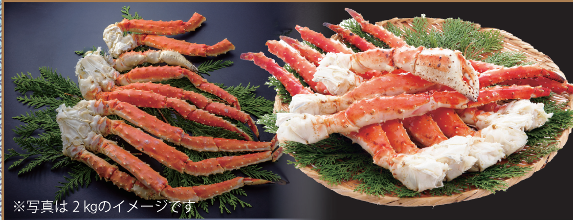
※写真は 2 kg のイメージです

厳選 特大 ボイルたらば蟹 1kg (税・送料込) 商品コード 1 9,500円